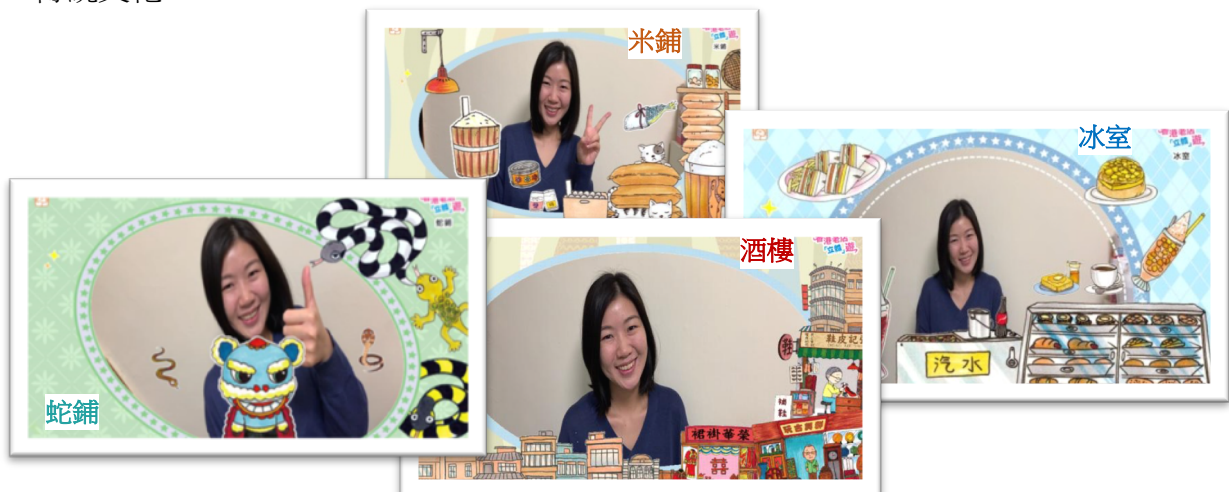
隨時可和舊時的店鋪「背景」玩自拍呢